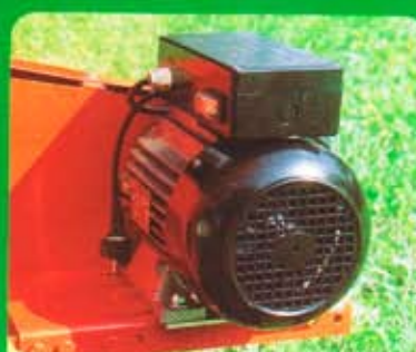
MOTORE ELETTRICO 3 E CV - 220 / 380 V